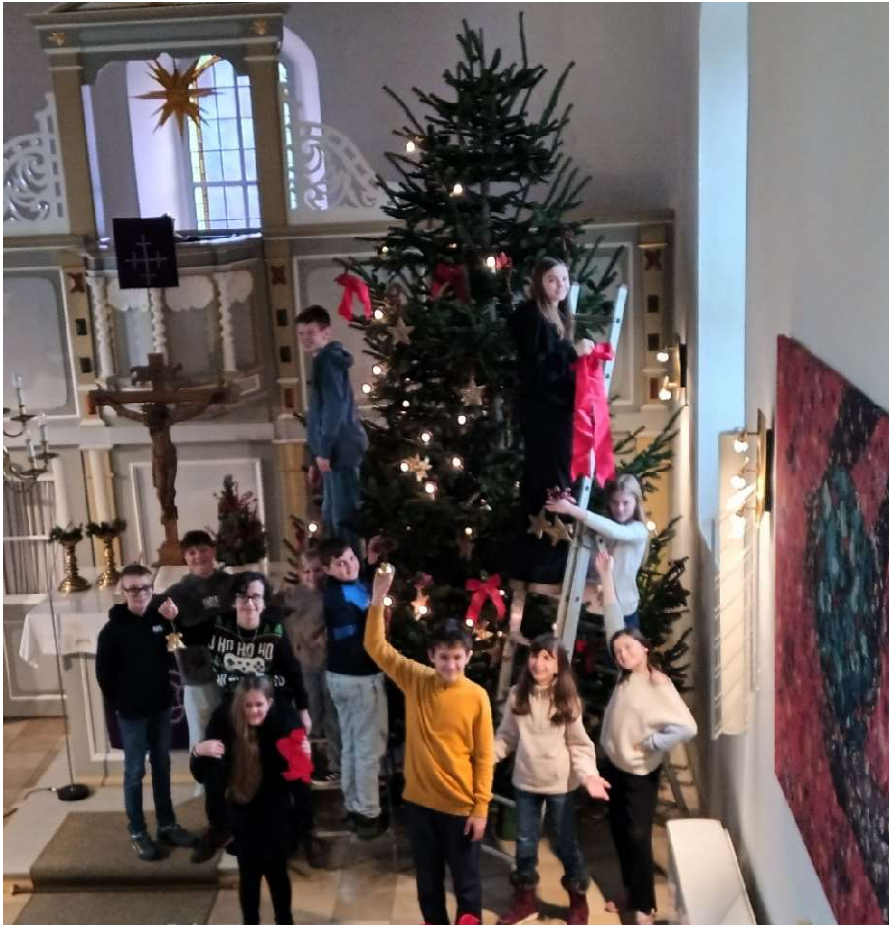
Schmücken des Weihnachtsbaumes 2024 in Broistedt