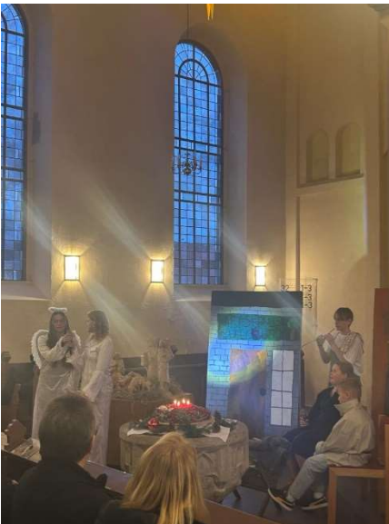
Barbecker Krippenspiel