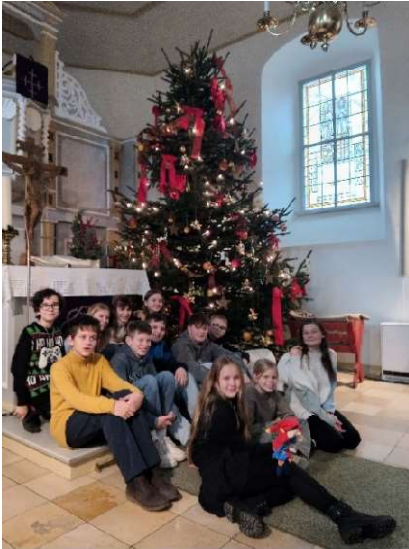
Broistedts fleißige Helferinnen und Helfer