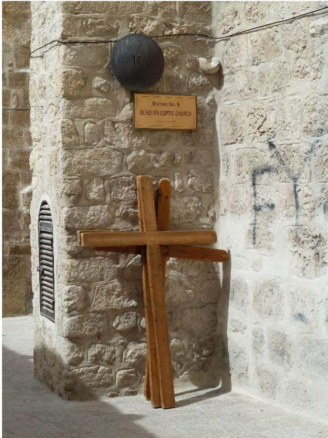
Kreuze vor der Grabeskirche in Jerusalem

Die ev. – luth. Kirchengemeinden Barbecke, Broistedt und Engelnstedt